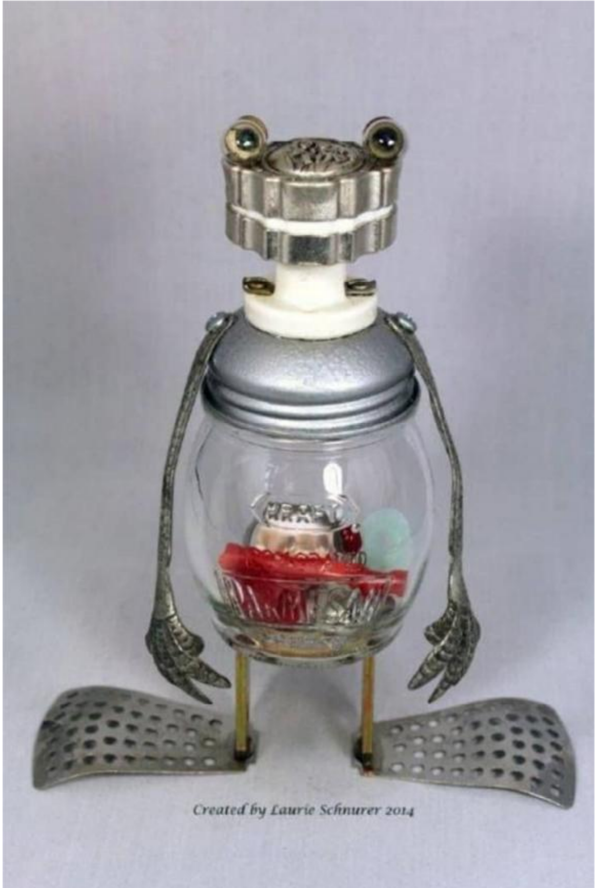
Created by Laurie Schnurer 2014