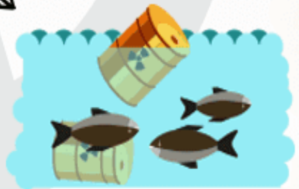
إلقاء المواد البترولية