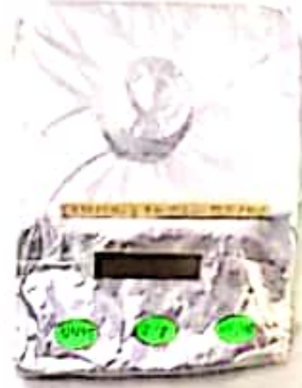
الميزان ذوالكفة الواحدة