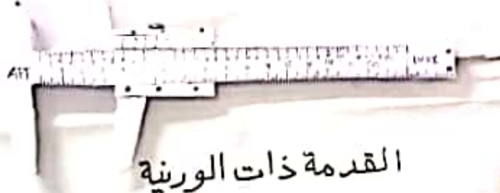
القدمة ذات الورنية