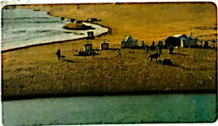
وادي الريان بمصر

البيعه يوجد / يوجد في جنوب سيناء (يسير اطلق في جليله في مصر)