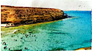
إحدى شواطئ مرسى مطروح