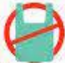
الحد من البلاستيك