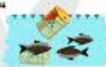
إلقاء النفايات البحرية في البحر